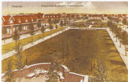
Mijnwerkerskolonie Treebeek begin jaren dertig.

Treebeek werd honderd jaar geleden – uiterst functioneel - aangelegd tussen de 2,5 kilometer van elkaar verwijderde staatsmijnen Emma en Hendrik. De mijnwerkers konden zo te voet naar 'de kof'. Een deel van de in 1913 door architect Willem Leliman (1878-1921) ontworpen woningen zijn keurig gerestaureerd, maar het centrum van Treebeek is in de jaren zeventig vakundig om zeep geholpen. Door de woningnood werden de klassieke mijnwerkerswoningen gesloopt en vervangen door die verdiepingen hoge portiekflats. Het centraal gelegen Treebeekplein, meer een stadsparkje dan een plein trouwens, verdween deels onder het asfalt, om ruimte te maken voor parkeerplaatsen. Van het tuindorp-concept van Leliman bleef bitter weinig over. Zonder te 'historiseren' wil Jo Janssen in